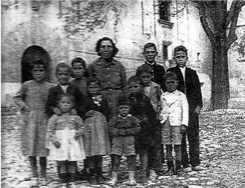
Curso escolar 1957-1958 en La Estrella (Mosqueruela)