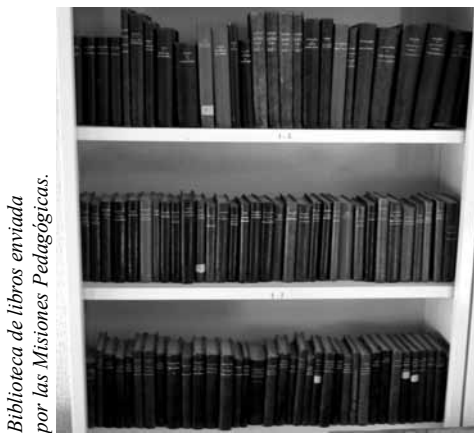
Biblioteca de libros enviada por las Misiones Pedagógicas.

Sin embargo, lo más destacado de este apartado, es la biblioteca de la II República que se mantiene en el ayuntamiento: se trata de una colección de libros de media piel que llegaron a los pueblos en arcones a través de las Misiones Pedagógicas. Dichos ejemplares trataban de temas “avanzados” para la época y los alumnos quedaban fascinados con su lectura. Fue un auténtico modelo de cultura popular.