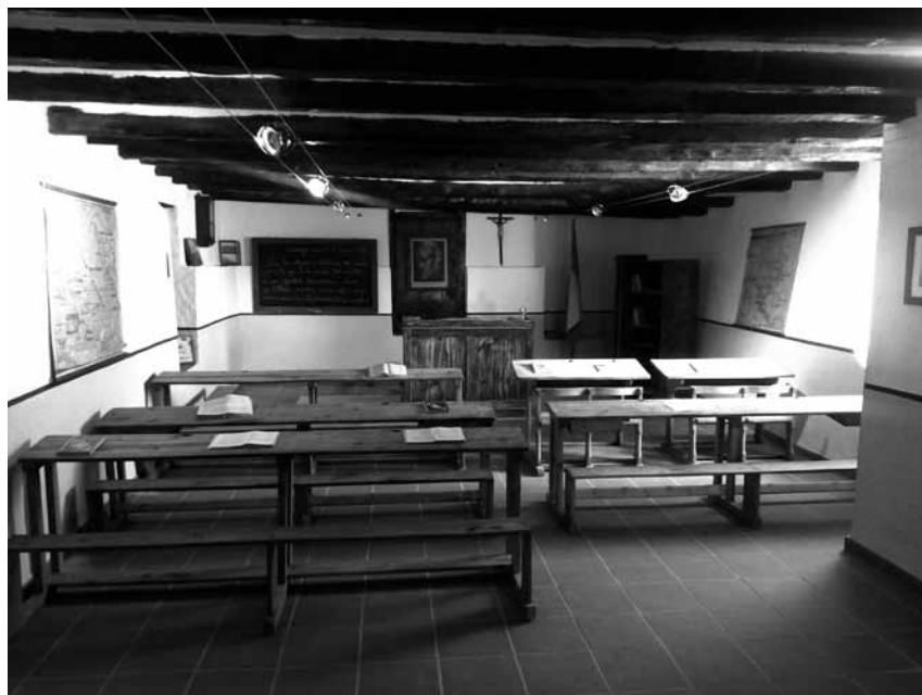
Recreación en una sala de la torre de Cantavieja, de la escuela del barrio de San Juan del Barranco

Recreación en una sala de la torre de Cantavieja, de la escuela del barrio de San Juan del Barranco.