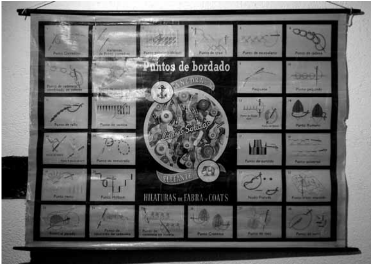
Cartel de puntos de bordado.

Sin embargo, lo más emblemático de esta escuela es la enciclopedia La Fuente de “Historia General de España”. La cual, aunque se cree que fue donada a la escuela, es de gran valor ya que su primera edición data de entre 1850 y 1867. Se difundió rápidamente por todo el estado y además, sirvió de modelo a autores de libros de texto y manuales de enseñanza y se fue adquiriendo entre las clases medias españolas, hasta el punto de que su posesión fue signo de distinción.