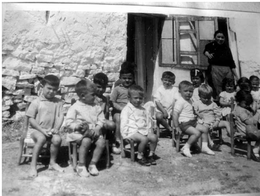
Escuela de infantil en el curso escolar 1965-66 (Mosqueruela)

Por último, destacar que el trabajo presentado no constituye el resultado final de una investigación, sino el análisis inicial de las posibilidades que los tipos de fuentes presentadas tienen de cara a la investigación histórico-educativa y como posibilidad didáctica para la enseñanza de la historia de la educación. A partir de ahora comienza una etapa nueva de las escuelas en el Maestrazgo.