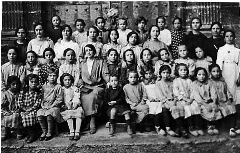
Año 1927. Foto de escuela de niñas cedida por Baltasar Monforte. ( www.tronchon.info ).