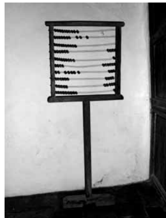
Ábaco grande con soporte.